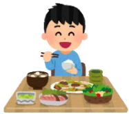
バランスのとれた食事